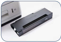
Reserve inkcartridge (HC-05BK)