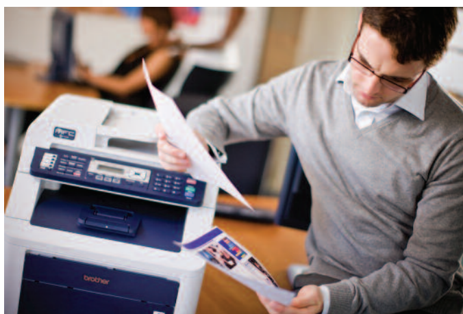
Creëer direct scherpe en heldere documenten in kleur op A4 formaat met 16 pagina's per minuut.