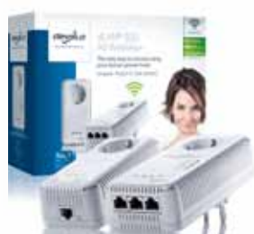
dLAN® 500 AV Wireless+ Starter Kit