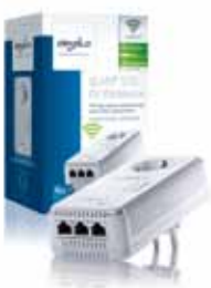
dLAN® 500 AV Wireless+

3 LAN-aansluitingen voor het aansluiten van drie bekabelde apparaten