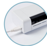
Stroomvoorziening via USB