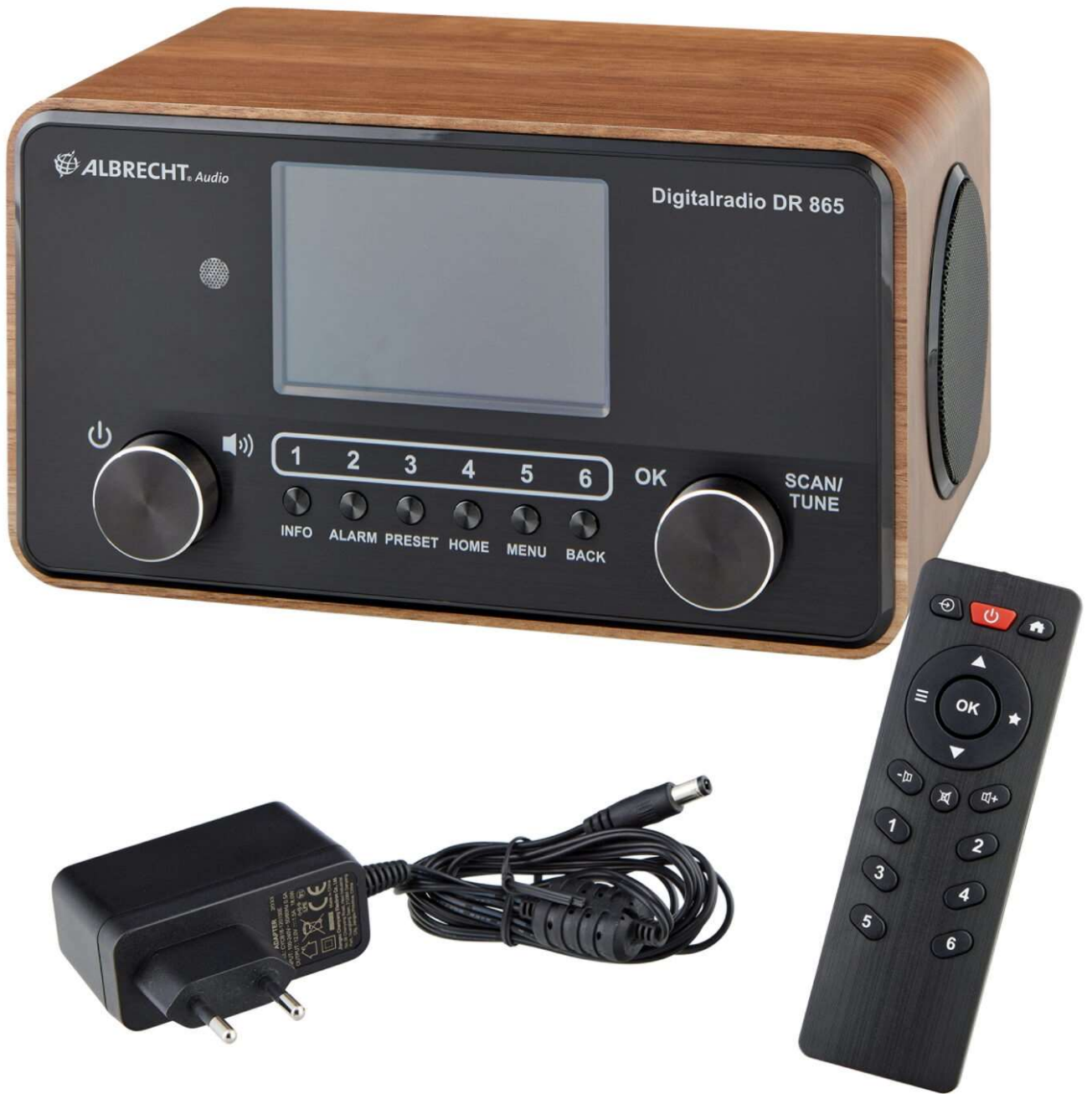
Das neue Albrecht DR 865 Senior