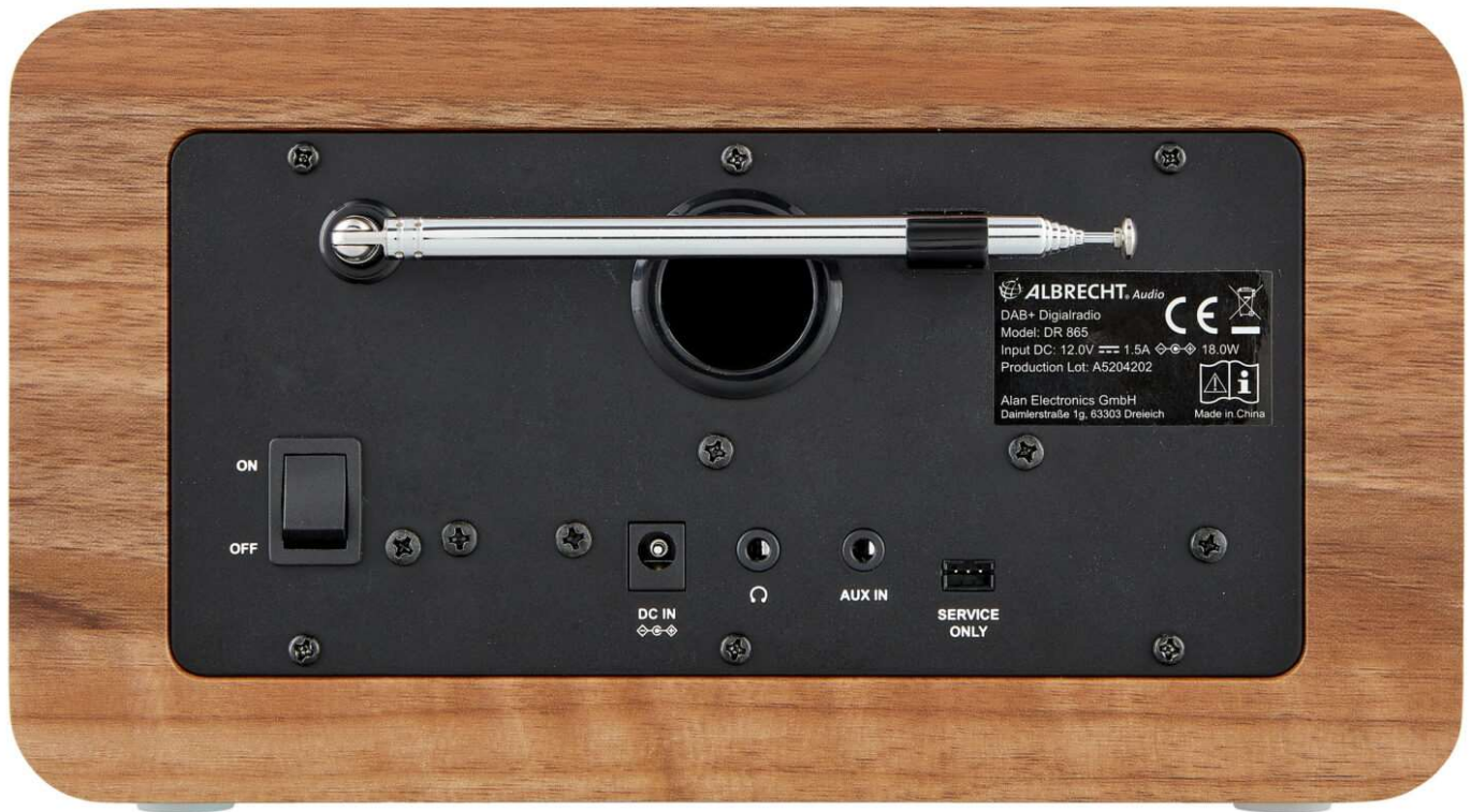
Das neue Albrecht DR 865 Senior